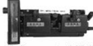
Belmogtwin MK II BELMOGTWIN