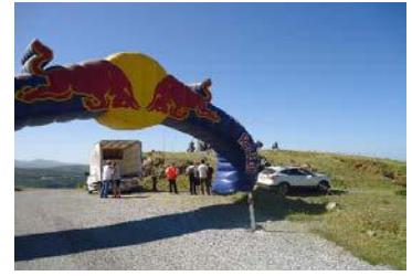
SSS - SEYİRCİ ÖZEL ETABI - POWER STAGE