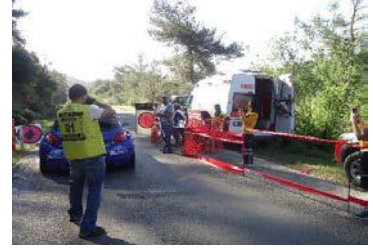
TAKIMLAR TOPLANTISI + SHAKEDOWN