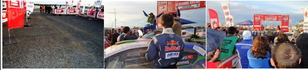
Start / Finish Medya