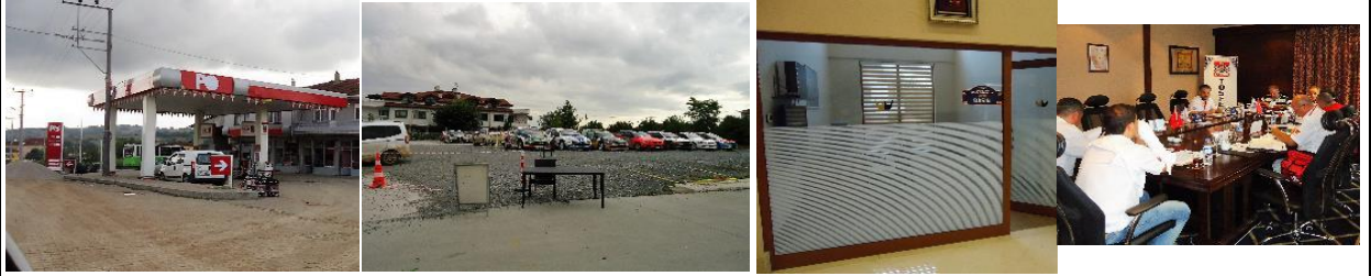
YAKIT İKMAL - GUN SONU KAPALIPARK - MEDYA ODASI - SPOR KOM.TOPL