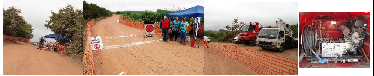
FORD OTOSAN ETABI