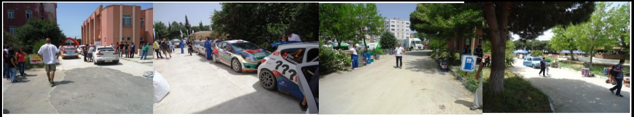
Toplama - Yakıt İkmal