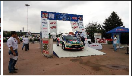
START KAPALIPARKI - START