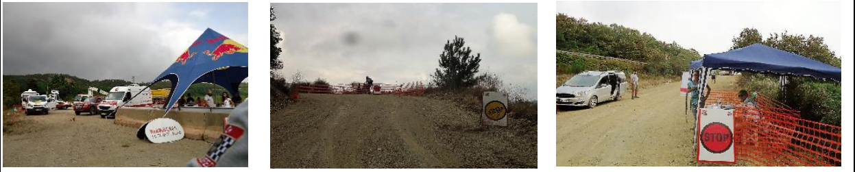
FORD OTOSAN ETABI