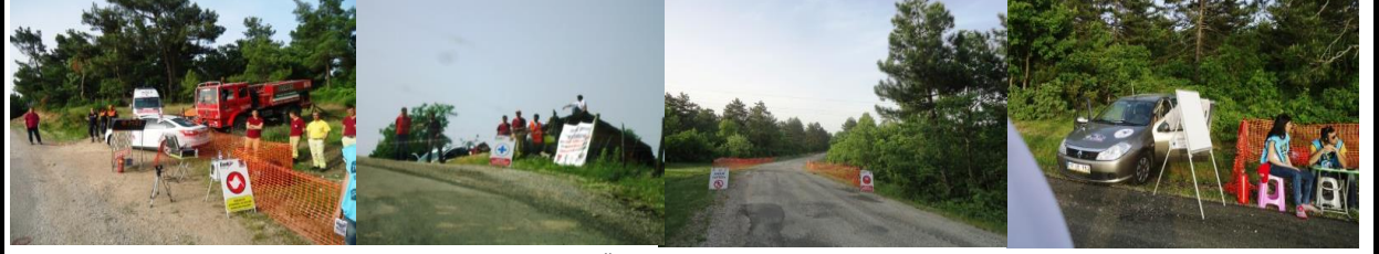
Özel Etap 3 Kurulum