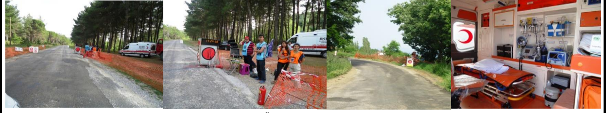
Özel Etap 2 Kurulum