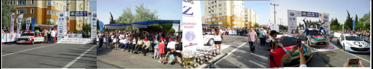
Finish - Ödül Töreni