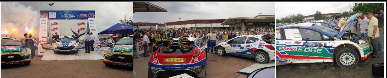
FINISH - ÖDÜL TÖRENİ - KAPALIPARK