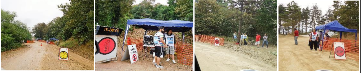
TOURNEO COURIER ETABI